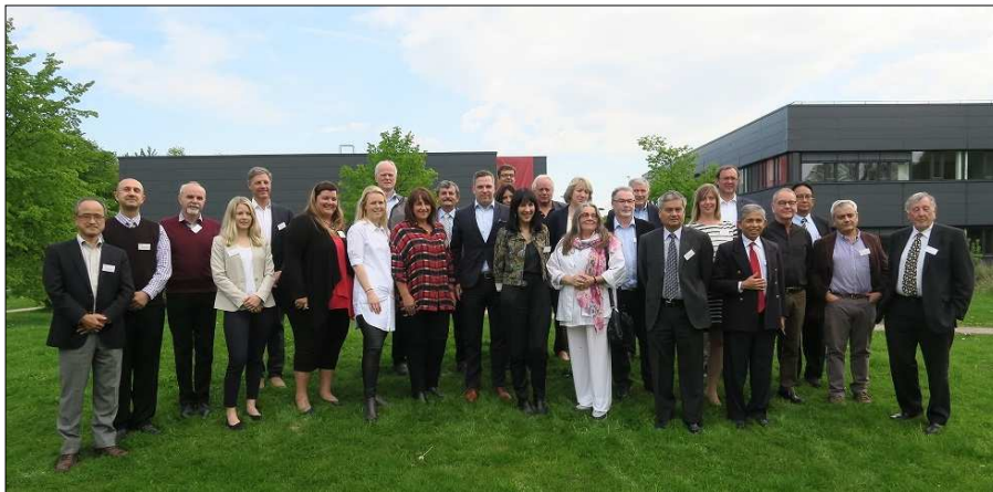
A Nemzetközi Geotermikus Egyesület (IGA) Igazgatótanácsának tagjai Bochumban

Egy, a maga nemében egyedülálló nonprofit intézmény.